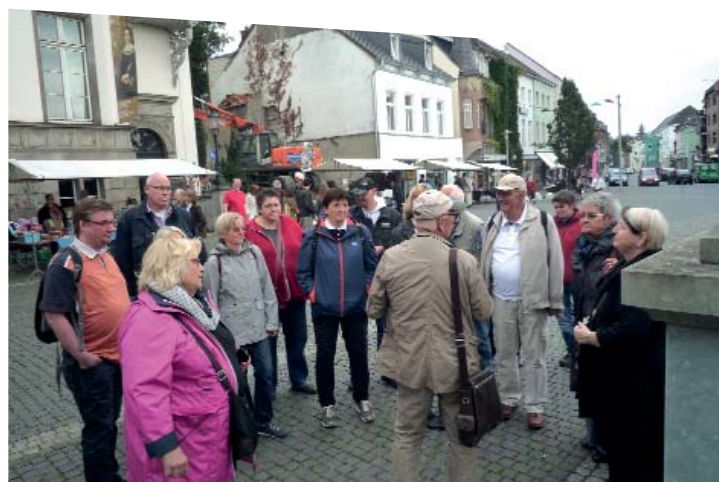
Die Ehrenamtlichen des Ons Zentrum erkundeten auf ihrem Ausflug das Städtchen Kleve. Solche Touren sind für den Teamgeist sehr wichtig.