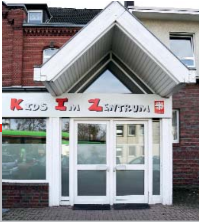
Frisch renoviert: KiZ-Domizil in Grevenbroich