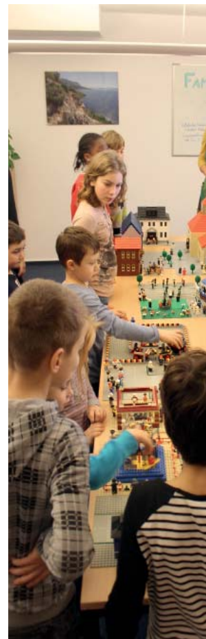
Kleine und große Besucher der Ausstellungseröffnung mit

Die Idee zur Ausstellung inspirierte auch andere: Die Kinder der Katholischen Kita St. Josef im Familienzentrum Vollrath Höhe lieferten einige Bauwerke, und die Schüler der Städtischen Katholischen