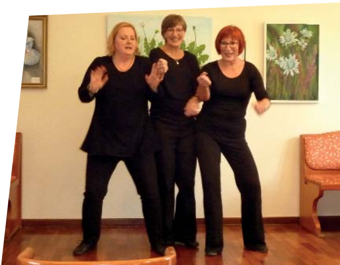
Das Playbacktheater „Über M.U.T.“ in Aktion