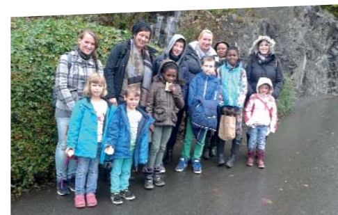
Die Frau-Ke Gruppe beim Aufstieg zur Attahöhle.

Die Fachberatungs- und Kontaktstelle FaKT schlug ihre Zelte mit sechs Männern und zwei Frauen für fünf Tage auf dem Campingplatz in Oberweis bei Bitburg auf. Direkt neben der Prüm zu schlafen war ein tolles Erlebnis. Auf dem Programm standen Tagesausflüge in den Eifelzoo, zu den Irreler Wasserfällen und nach Echterbacher Brück. Ein allabendliches Lagerfeuer sorgte für Wärme und Romantik, Sternenhimmel eingeschlossen.