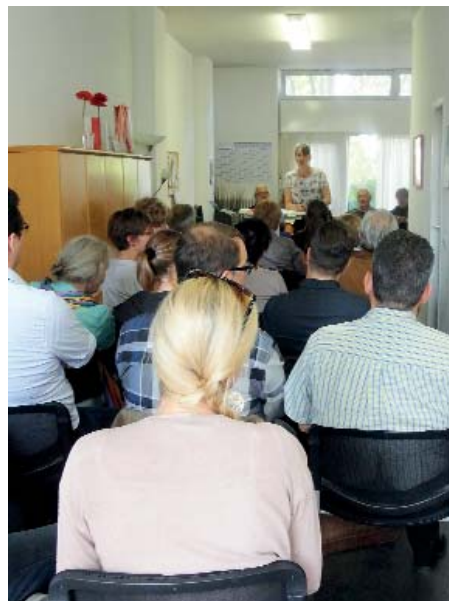
Regelr Austausch in der Freiwilligenzentrale

Das Team der Freiwilligenzentrale machte nochmals deutlich, dass die Vermittlung von Ehrenamtlichen kostenfrei ist und jede gemeinnützige Institution oder Einrichtung dieses Angebot nutzen kann, um vakante Ehrenamtsstellen zu besetzen. Weiterhin fungiert die Freiwilligenzentrale als Ansprechpartner für alle Belange rund um das Ehrenamt. Ein regelmäßiges gegenseitiges Feedback erleichtert die Zusammenarbeit