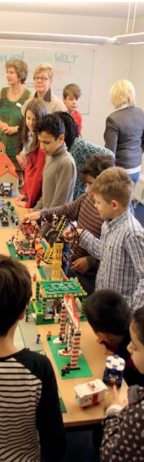
staunten und spielten bei großer Begeisterung.

Grundschule St. Josef bauten ihre komplette Schule nach – ein kunterbuntes Gesamtkunstwerk. Die Teilnehmer der Katholischen Jugend-Agentur Düsseldorf an der Diedrich-Uhlhorn-Realschule schufen einen originellen Lego-Trickfilm mit dem Titel „Freunde aus aller Welt feiern ein Fest“.