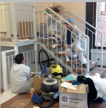
Die EMC 2 -Mitarbeiter brachten die Räume der ehemaligen Radstation auf Vordermann.