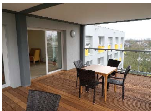
Großzügige Terrassen bieten frische Luft und tolle Ausblicke auf den Park und die Umgebung.

Verschwunden sind die alten Balkone, denn sie waren erstens zu eng und zweitens durch eine Türschwelle nicht barrierefrei nutzbar. Bodentiefe