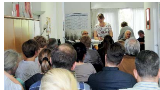
Der runde Tisch in der Freiwilligenzentrale stieß auf große Resonanz.

Im September 2015 lud das Team der Freiwilligenzentrale zum „Runden Tisch“ in die Räumlichkeiten am Meererhof ein. Die Möglichkeit zum Austausch und zur Diskussion wurde rege genutzt. In Kaarst beteiligte sich die Freiwilligenzentrale an der Ehrenamtsbörse und führte zusätzlich eine monatliche Abendsprechstunde im Kaarster Rathaus ein.