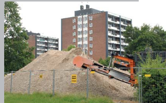
Städtebaulich nachvollziehbar, sozialpolitisch ein Sündenfall: Diese Wohnblocks in Neuss-Weckhoven fielen der Abrissbirne zum Opfer.

ment ist oft nicht machbar, weil langjährige Arbeitslosigkeit zu Überschuldung und damit zu einem Schufa-Eintrag geführt hat. Da Vermieter heute sehr häufig eine Schufa-Auskunft verlangen, kann die Negativauskunft das K.O.-Kriterium sein. Denn immer öfter lehnen es Vermieter – auch große Wohnungsbauunternehmen – ab, Mietverträge mit Menschen abzuschließen, die einen solchen Schufa-Eintrag haben.