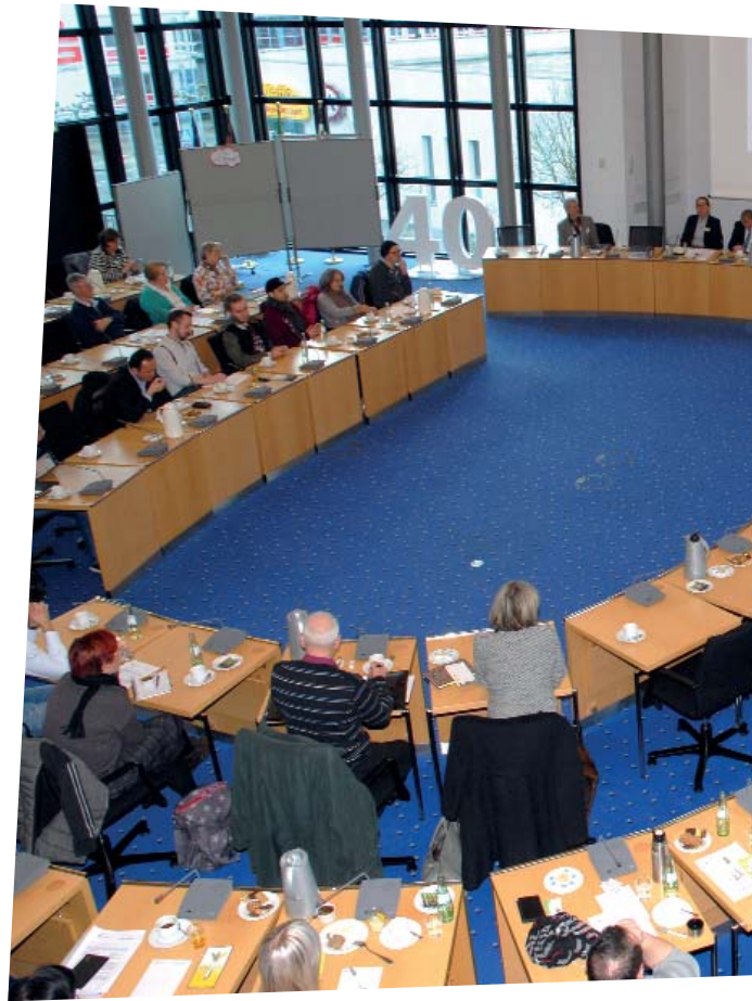
Rund 60 Teilnehmer kamen zur ersten Demokratiekonferenz ins Grevenbroicher Kreishaus und entwickelten erste Projektideen.

Im ersten Schritt bewilligte der Begleitausschuss zwei Projekte: Das