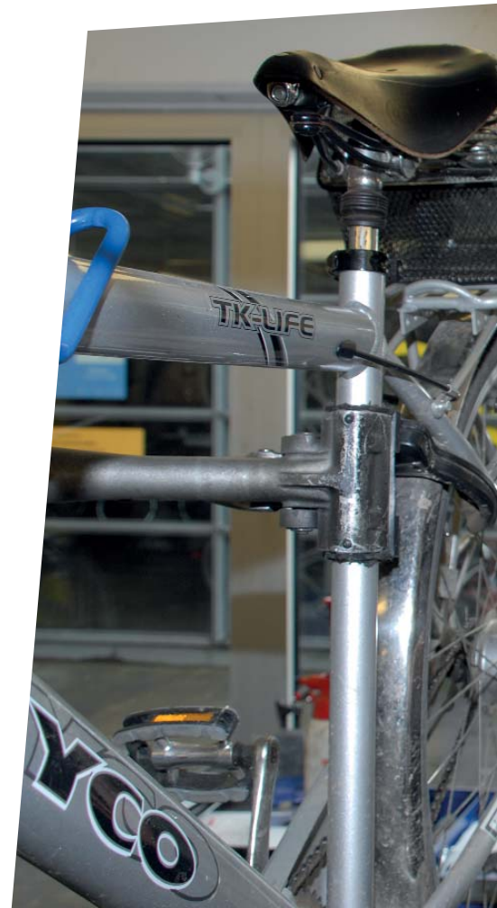
Die drei Caritas-Radstationen in Dormagen, ein Auszubildender beschäftigt werden. Das