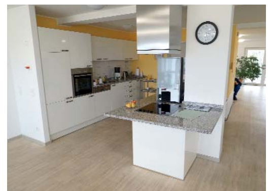
Eine moderne Küche mit unterfahrbarer Kochinsel gehört zur Ausstattung der Gemeinschaftsbereiche.